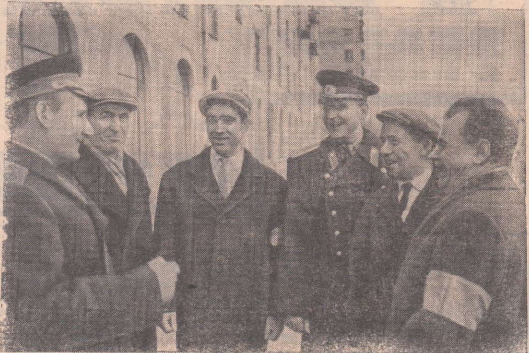
Советская милиция пользуется большой любовью народа, потому что она стоит на страже интересов народа, охраняет общественный порядок, социалистическую собственность, права граждан.

Люди в синих шинелях — всегда на боевом посту и всюду они проявляют находчивость, смелость, мужество — и в борьбе с преступниками, хулиганами и при оказании помощи людям.